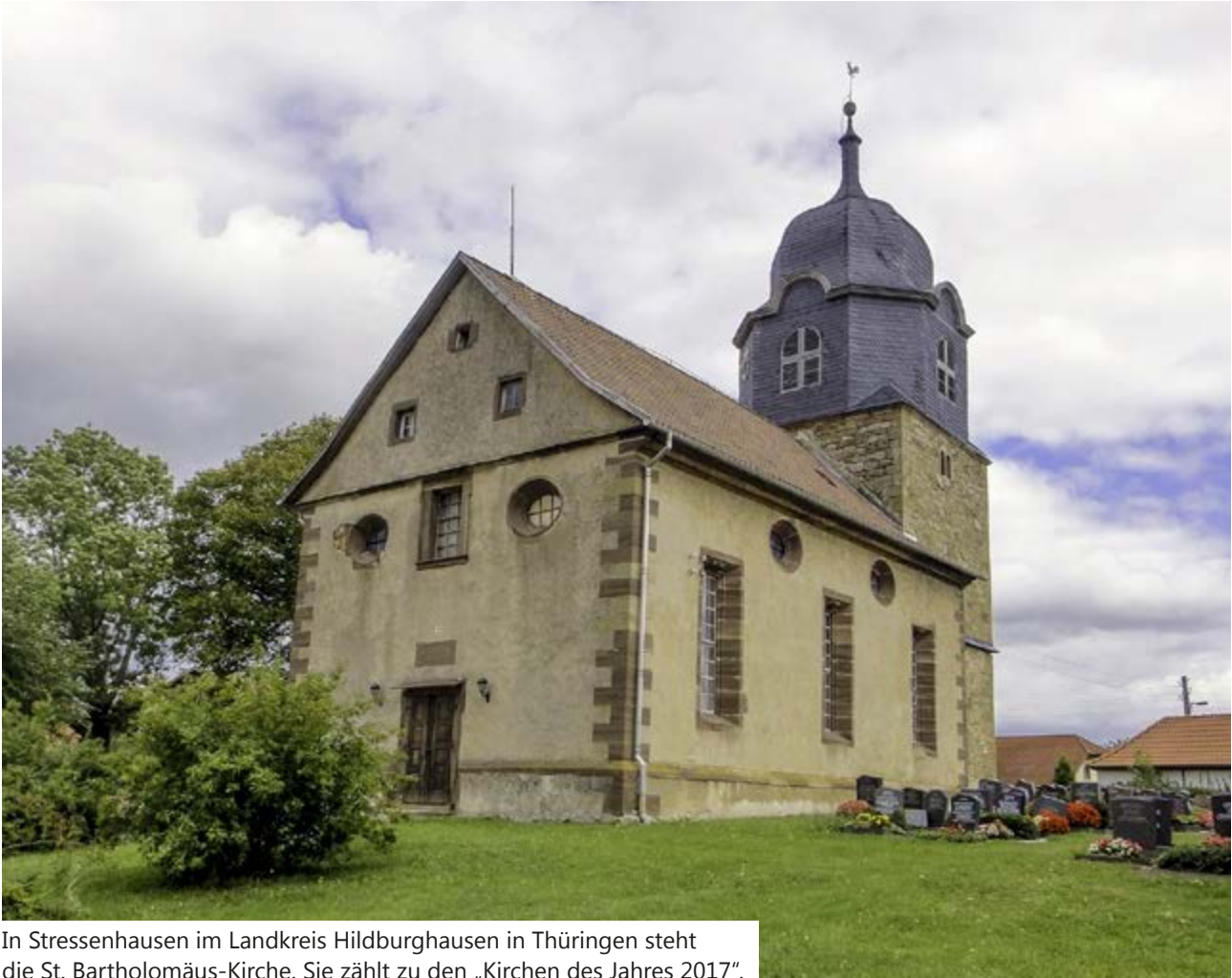
In Stressenhausen im Landkreis Hildburghausen in Thüringen steht die St. Bartholomäus-Kirche. Sie zählt zu den „Kirchen des Jahres 2017“.