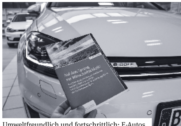
Umweltfreundlich und fortschrittlich: E-Autos.

Der Kreiskirchenrat entschied sich für den E-Golf, da dieser mit seiner Reichweite und der Nutzbarkeit passend für die Dienste in den fünf Regionen erschien. Die Standorte der Autos sind Hötensleben, Egeln, Schönebeck, Gatersle-