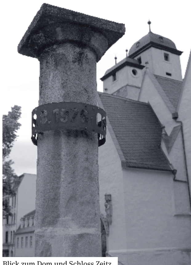
Blick zum Dom und Schloss Zeitz