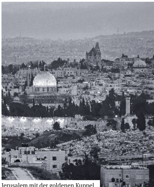
Jerusalem mit der goldenen Kuppel

Die Jüdische Landesgemeinde Thüringen und die Arbeitsgemeinschaft „Kirche und Judentum“ haben im Februar die neue Veranstaltungsreihe „Blickpunkt Jerusalem“ gestartet. Fragen und Erscheinungen der Gegenwart wie z. B. die Debatte um Jerusalem als Hauptstadt Israels oder die wachsenden Besucherzahlen an der „Klagemauer“ können mit dieser Reihe in einen größeren Zusammenhang eingeordnet werden.